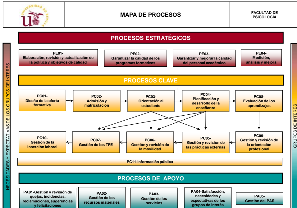
Figura 2. Mapa de procesos de la Facultad de Psicología

El mapa de procesos de la Facultad de Psicología da respuesta a los criterios del Programa IMPLANTA de DEVA que se muestran en el gráfico siguiente: